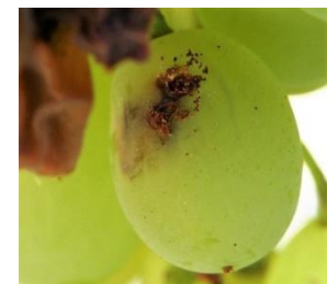
Προσβολή σε ράγα. Τρύπα και αποχωρήματα

Δευτερογενείς σήψεις αναπτύσσονται πάνω στις φαγωμένες ρώγες (βοτρύτης, όξινη σήψη κλπ.)