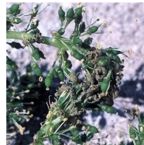
Προσβολή σε άνθη

Εξελίσσεται στις ανθοταξίες. Το σκουλήκι τρώει τα άνθη, τα δένει με ένα μεταξωτό νήμα και φτιάχνει ένα κουκούλι που προδίδει την παρουσία της.