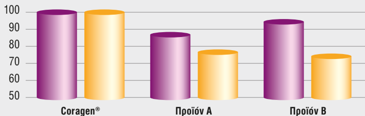
Αποτελεσματικότητα (%) σε προσβεβλημένα καρύδια βαμβακιού*

Το πράσινο σκουλήκι είναι με διαφορά ο πιο επικίνδυνος εντομολογικός εχθρός για το βαμβάκι. Αποτυχία καταπολέμησής του μπορεί να οδηγήσει σε ολοκληρωτική καταστροφή της καλλιέργειας και ανεπανόρθωτη οικονομική ζημιά για τον παραγωγό. Χρόνια πειραματισμού στην Ελλάδα αλλά και άλλες χώρες έχουν αποδείξει πως το Coragen® (Κόρατζεν) αποτελεί μια σταθερά αξιόπιστη λύση για τον αποτελεσματικό έλεγχο του πράσινου σκουληκιού.