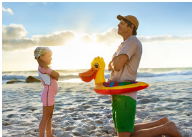
Αποτελεσματική αντηλιακή προστασία με φίλτρα UV από τη σειρά προϊόντων Tinosorb®, Uvinul® και Z-COTE®