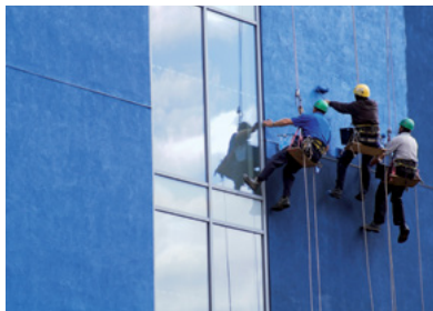
Βαφές με βάση το νερό που κατασκευάζονται με το προϊόν Acronal®