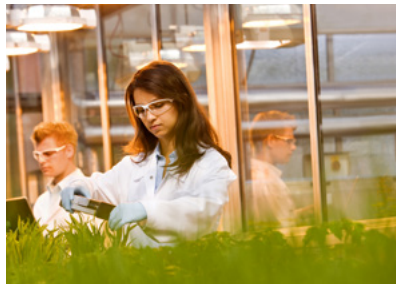
Καινοτόμα προϊόντα και λύσεις φυτοπροστασίας για μία αειφόρο γεωργία

Πιο κάτω, θα βρείτε τρία παραδείγματα καινοτόμων και βιώσιμων προϊόντων της BASF που βοηθάνε τους πελάτες μας που δραστηριοποιούνται σε κλάδους στρατηγικής σημασίας, όπως ο αγροτικός, ο βιομηχανικός και ο κατασκευαστικός να είναι πιο επιτυχημένοι.