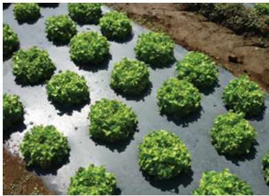
Εσονίο® Mulch, βιοδιασπώμενο φύλλο εδαφοκάλυψης για τη γεωργία