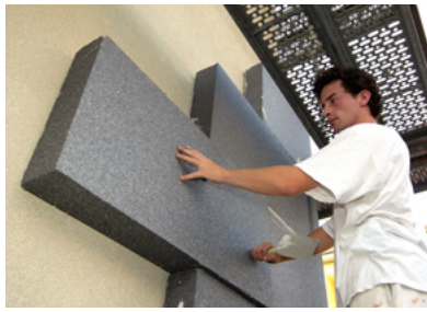
Neopor®, το αυθεντικό προϊόν της BASF για μια αποτελεσματική μόνωση