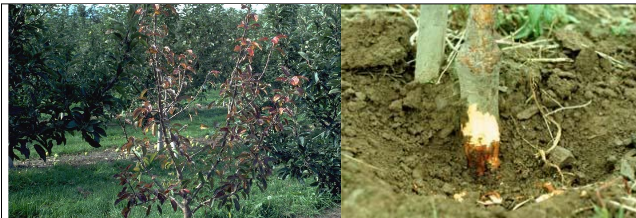
προσβολή Μηλιάς από Phytophthora