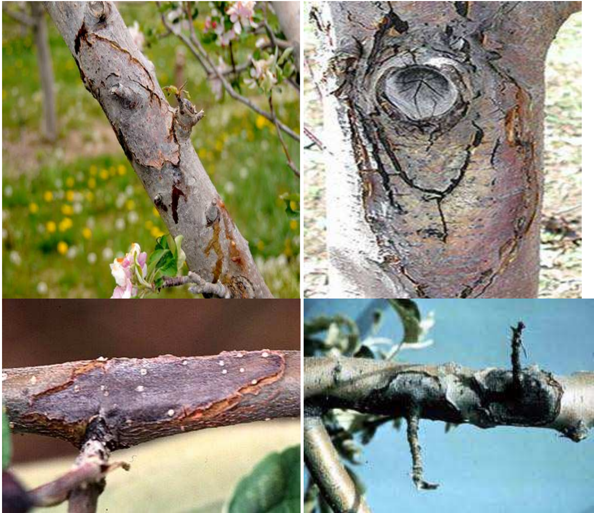
Εικ. Χαρακτηριστικές προσβολές (έλκη) του βακτηρίου στον κορμό και σε κλάδους

Προσοχή: Σε κάθε περίπτωση να τηρούνται αυστηρά οι οδηγίες χρήσης των φυτοπροστατευτικών προϊόντων για την αναλογία χρήσης, την συνδυαστικότητα, τον κίνδυνο φυτοτοξικότητας, το διάστημα μεταξύ τελευταίας επέμβασης και συγκομιδής και τα μέτρα προστασίας για την αποφυγή δηλητηρίασης.