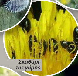
Σκαθάρι της γύρης