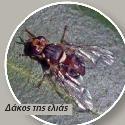
Δάκος της ελιάς