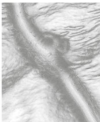
Ζωντανό μυκήλιο Ωιδίου με πλάκα προσκολλησεως

Λόγω του ότι το VitiSan® δρα με πολυδιάστατο τρόπο δεν υπάρχει κίνδυνος ανάπτυξης ανθεκτικότητας ακόμα και σε συχνές εφαρμογές.