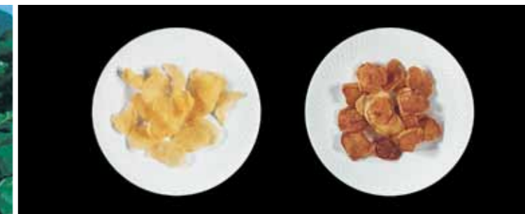
Τηγανητές Πατάτες (chips)