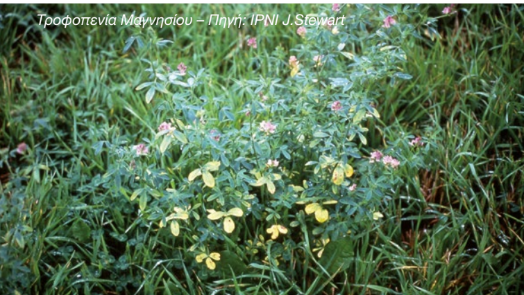
Τροφопενία Μαγνησίου

Ο παραπάνω πίνακας περιγράφει την απορρόφηση των βασικών μακροστοιχείων που αντιστοιχεί σε κάθε τόνο παραγόμενου σανού. Εάν δηλαδή η παραγωγή ανά στρέμμα είναι μεγαλύτερη του ενός τόνου τότε αντίστοιχα αυξάνονται και ποσότητες των στοιχείων που απομακρύνονται από το έδαφος.