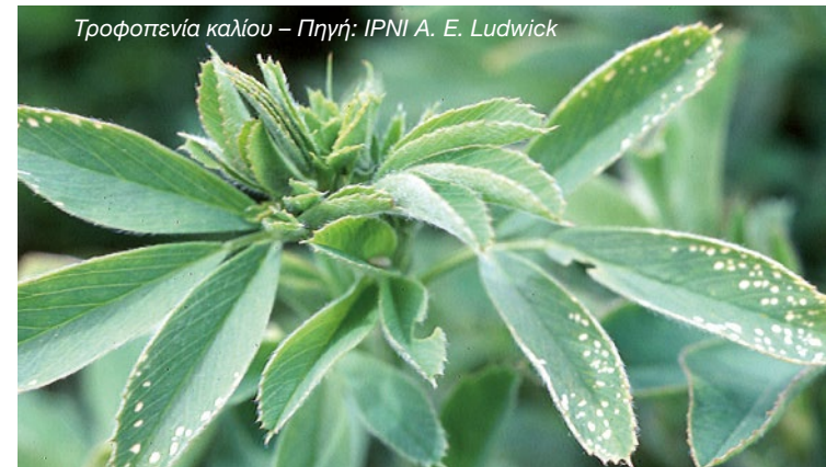
Τροφопενία καλίου

Εφόσον χρησιμοποιηθεί στην χειμερινή λίπανση (Φλεβάρη - Μάρτη) αποφεύγουμε την μια εφαρμογή το καλοκαίρι.